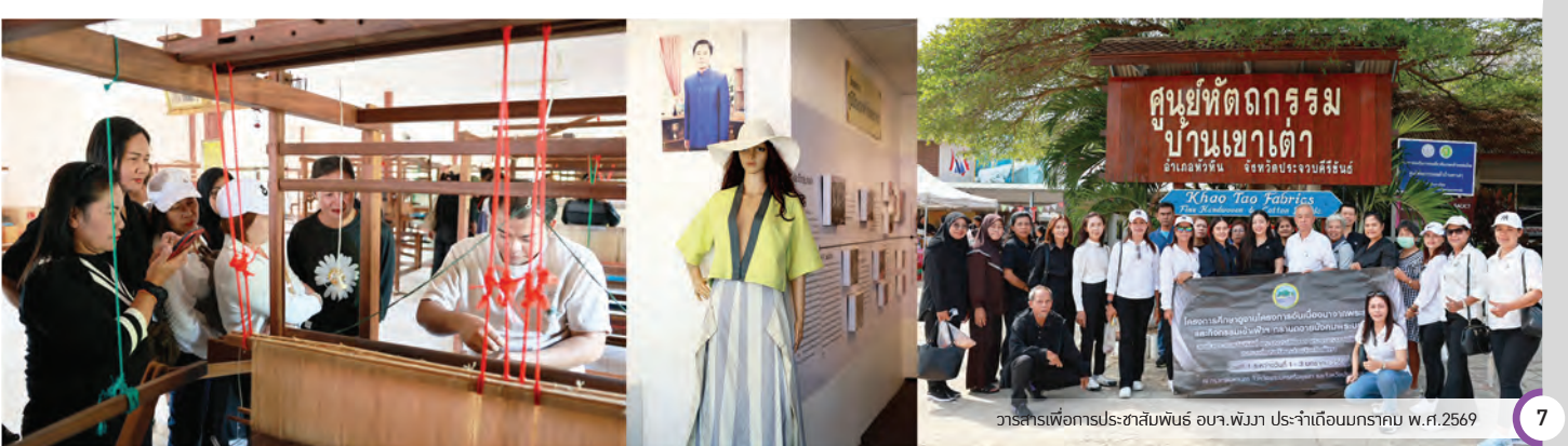
วาระสารเพื่อการประชาสัมพันธ์ อบจ.พังงา ประจำเดือนมกราคม พ.ศ.2569

คณะผู้บริหาร สมาชิกสภา ข้าราชการ เจ้าหน้าที่องค์การบริหารส่วนจังหวัดพังงา และประชาชนจังหวัดพังงา เข้าร่วมกิจกรรมศึกษาดูงาน ณ ศูนย์หัตถกรรมบ้านเขาเต่า เพื่อเรียนรู้กระบวนการผลิตงานหัตถกรรมทอผ้าดั้งเดิมและภูมิปัญญาท้องถิ่นที่เป็นมรดกทางวัฒนธรรมของชุมชนท้องถิ่น เมื่อวันที่ 3 มกราคม 2569 ศูนย์หัตถกรรมบ้านเขาเต่า เป็นแหล่งผลิตงานทอผ้าและผลิตภัณฑ์หัตถกรรมที่สืบทอดจากโครงการพระราชดำริ ให้ชุมชนมีอาชีพเสริมและสร้างรายได้อย่างยั่งยืน โดยกลุ่มทอผ้าบ้านเขาเต่าได้ดำเนินการสืบสานภูมิปัญญามากกว่า 60 ปี ด้วยเทคนิคการทอผ้าไหมและผ้าฝ้ายที่มีเอกลักษณ์ พร้อมทั้งถ่ายทอดความรู้ให้แก่ผู้สนใจที่มาเยือนศูนย์